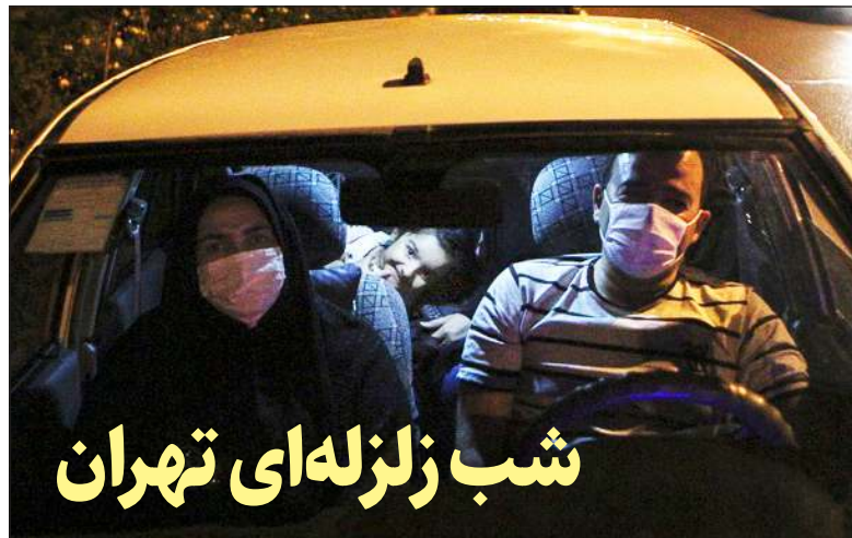
شب زلزله ای تهران