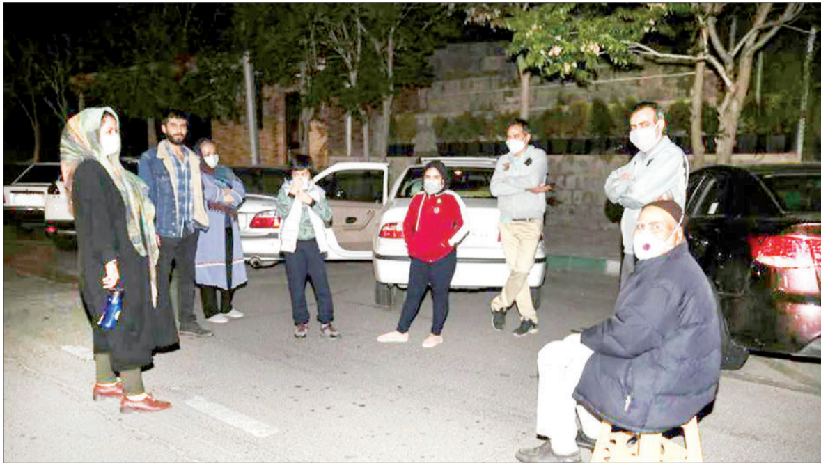
زمین‌لرزه در کلانشهر تهران به حدی بود که شهروندان تهرانی را به خیابانها کشاند و برخی از مردم تهران برای حفظ جان خود شب را در خیابان‌ها و پارک‌ها به صبح رساندند