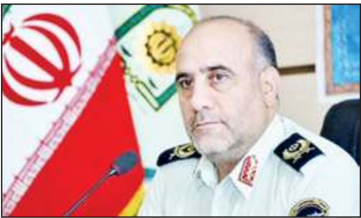
رئیس پلیس پایتخت: