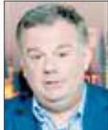
کارلبره مار کونت